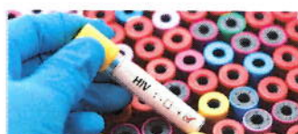
UNTERSUCHUNGEN ZUR COVID-19 ERKRANKUNG BEI HIV PATIENTINNEN

Die H.W. & J. Hector Stiftung, Weinheim, schreibt für 2020 eine Projektförderung (Sachmittel/Personalkosten) aus zum Thema: