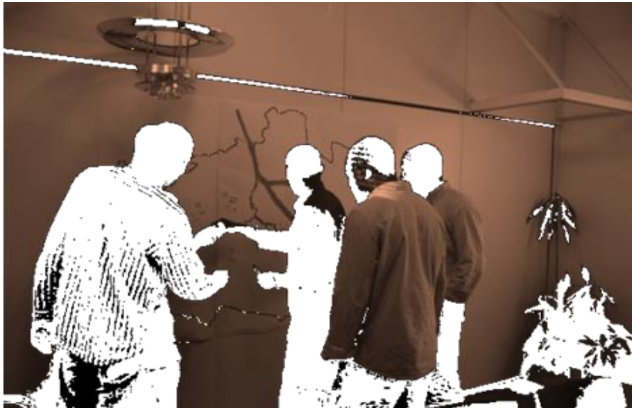
Einzeichnen auf Karte